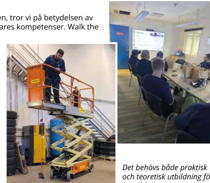
Det behövs både praktisk och teoretisk utbildning för att nå rätt kompetens

Då säkerhet är en av våra viktigaste hållbarhetsfrågor, utgår en stor del av medarbetarnas kompetensutveckling just utifrån ett säkerhetsperspektiv.